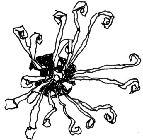
En un día frío

Aunque los pétalos del avellano de bruja parecen muy delicados, las temperaturas heladas no los dañan. En el frío, enrollan sus pétalos como un espiral para protegerse, y en los días cálidos despliegan sus pétalos como un espantasuegras.